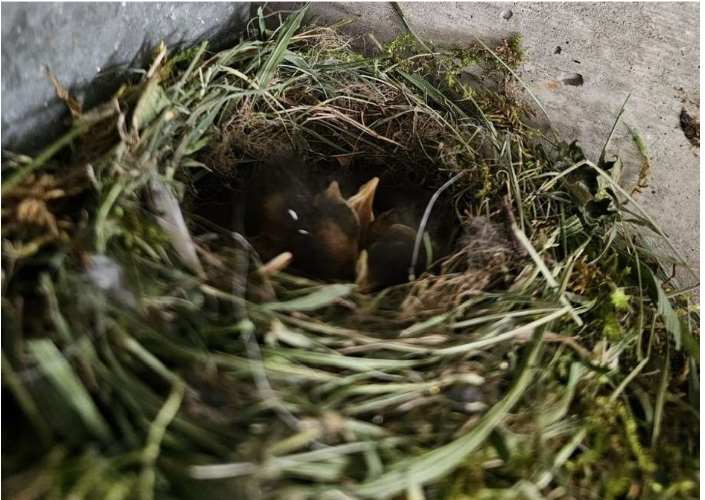
Vogelnest im Schulhaus Mönthal

Der Redaktionsschluss ist jeweils am 10. Tag jeden Monats.